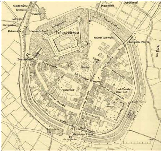
Plan von Stadt und Festung Detmold aus dem Jahre 1660.