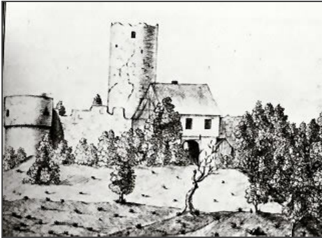
Quelle: Engel, Wilhelm ; Janssen, Walter ; Kunstmann, Hellmut - Die Burgen Frankenberg über Uffenheim | Neustadt a. d. Aisch, 1984.

Informationen für Besucher | Bilder | Grundriss | Historie | Literatur | Links