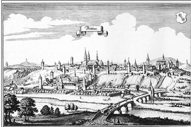
Merian, Matthäus - Topographia Hassiae, Et Regionum Vicinarum | Frankfurt am Main, 1655

Informationen für Besucher | Bilder | Grundriss | Historie | Literatur | Links